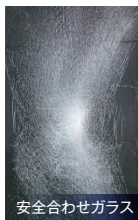
安全合わせガラス